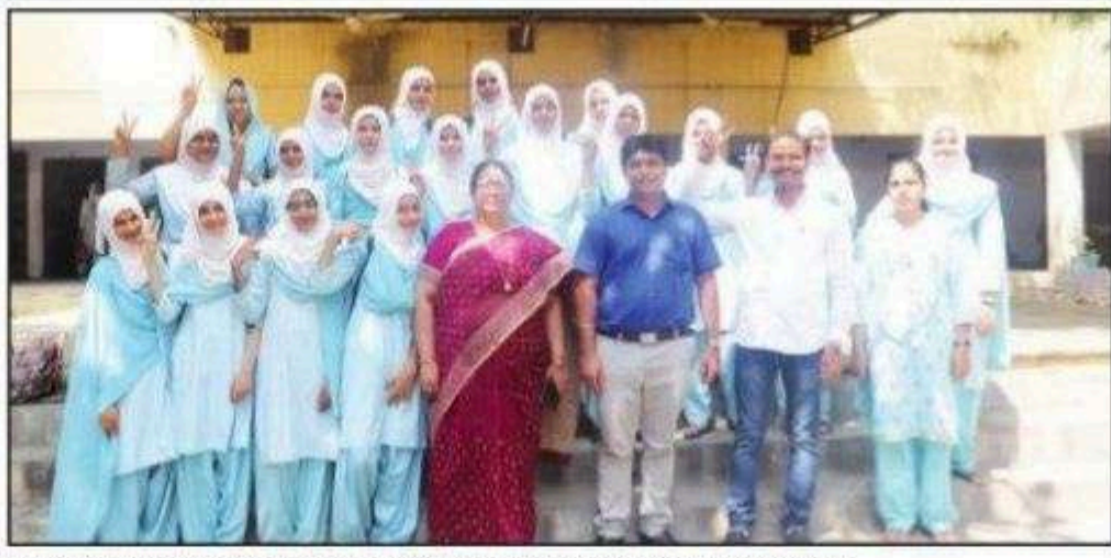
ಕಲಬುರಗಿಯಲ್ಲಿ ಸೋಮವಾರ ಯುವ ಮಹಿಳಾ ನಾಯಕತ್ವ ಕಾರ್ಯಾಗಾರ ನಡೆಯಿತು.