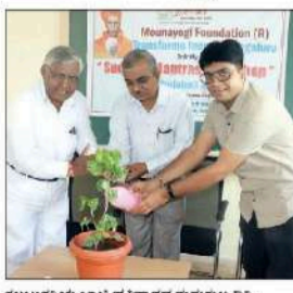
ಕಲಬುರಗಿಯಲ್ಲಿ ಸಂಯುಕ್ತ ಸಂಸ್ಥೆಯು ದೇಶದಾದ್ಯಂತ ಕೊಡುಗೆ ನೀಡುವ ವ್ಯಕ್ತಿತ್ವ ರೂಪಿಸಿಕೊಂಡು ಅಧುನಿಕ ಕಾಲಕ್ಕೆ ತಕ್ಕಂತೆ ನಾಯಕತ್ವ ಗುಣ ಬೆಳೆಸಿಕೊಳ್ಳುವುದು, ಬೆಲೆಗಳಿಗೆ ತಕ್ಕಂತೆ ಆಡುವ ಶಕ್ತಿಯನ್ನು ಬೆಳೆಸಿಕೊಳ್ಳುವುದು ಮತ್ತು 'ನಿಮ್ಮೊಳಗಿನ ಶಕ್ತಿ' ಎಂದು ಸಾರಂಗವರದ ತೀರಾಚಾರ್ಯರ ನ್ಯಾಯಾಜಿ ವಿನ್ಯಾಸಗಳಿಗೆ ಸಲಹೆ ನೀಡಿದರು.