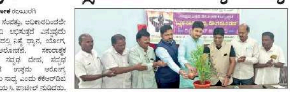
ನಗರದ ಪತ್ರಿಕಾ ಪ್ರವಚನದಲ್ಲಿ ಮಾಧ್ಯಮ ಮಿತ್ರರು, ಅವರ ಕುಟುಂಬಸ್ಥರಿಗೆ 'ಒತ್ತಡ ರಹಿತ ಮನಸ್ಸು ರೋಗ ರಹಿತ ದೇಹ' ರಿಫ್ರೆಶ್‌ಮೆಂಟ್ ಕಾರ್ಯಕ್ರಮದ ಪ್ರಾರಂಭ.

ವಿಕ ಸುದ್ದಿಯೊಂದಿಗೆ ವಿಕ ಸುದ್ದಿಯೊಂದಿಗೆ ವಿಕ ಸುದ್ದಿಯೊಂದಿಗೆ