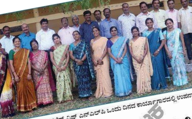
ಸಿಂದಗಿಯ ಟೀಟಿಂಗ್ ಎಕ್ಸ್‌ಲೆನ್ಸ್‌ವಿಥ್ ಎನ್‌ಎಲ್‌ಪಿ ಒಂದು ದಿನದ ಕಾರ್ಯಾಗಾರದಲ್ಲಿ ಉಪನ್ಯಾಸಕರು ಪಾಲ್ಗೊಂಡಿದ್ದರು.