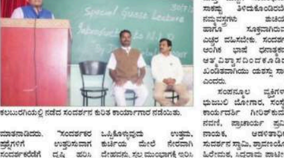
ಕಲಬುರಗಿಯಲ್ಲಿ ನಡೆದ ಸಂದರ್ಶನ ಕುರಿತ ಕಾರ್ಯಾಗಾರ ನಡೆಯಿತು.

ಸಂ.ಕ. ಸಮಾಚಾರ ಕಲಬುರಗಿ ಸಂ.ಕ. ಸಮಾಚಾರ ಕಲಬುರಗಿ ಸಂ.ಕ. ಸಮಾಚಾರ ಕಲಬುರಗಿ