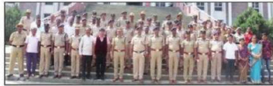
ಕಲಬುರಗಿಯಲ್ಲಿ ಮಂಗಳವಾರ ನಡೆದ ತರಬೇತಿ ತಿರುವಲ್ಲಿ ಪೊಲೀಸ್ ಅಧಿಕಾರಿಗಳು.

ಸಮಾಚಾರ ಕಲಬುರಗಿ ಸಮಾಚಾರ ಕಲಬುರಗಿ ಸಮಾಚಾರ ಕಲಬುರಗಿ